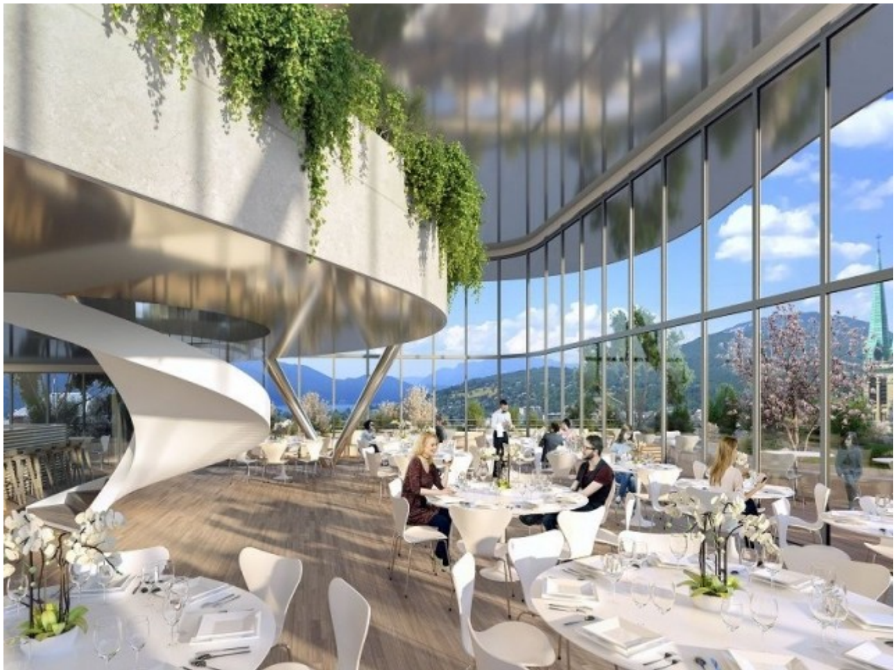
Un restaurant panoramique - L'Ecume des Ondes © Vincent Callebaut Architectures

Entre lac et montagne, les clients du restaurant pourront profiter de la vue, d'une cuisine raffinée, de produits locaux et d'une eau cristalline.