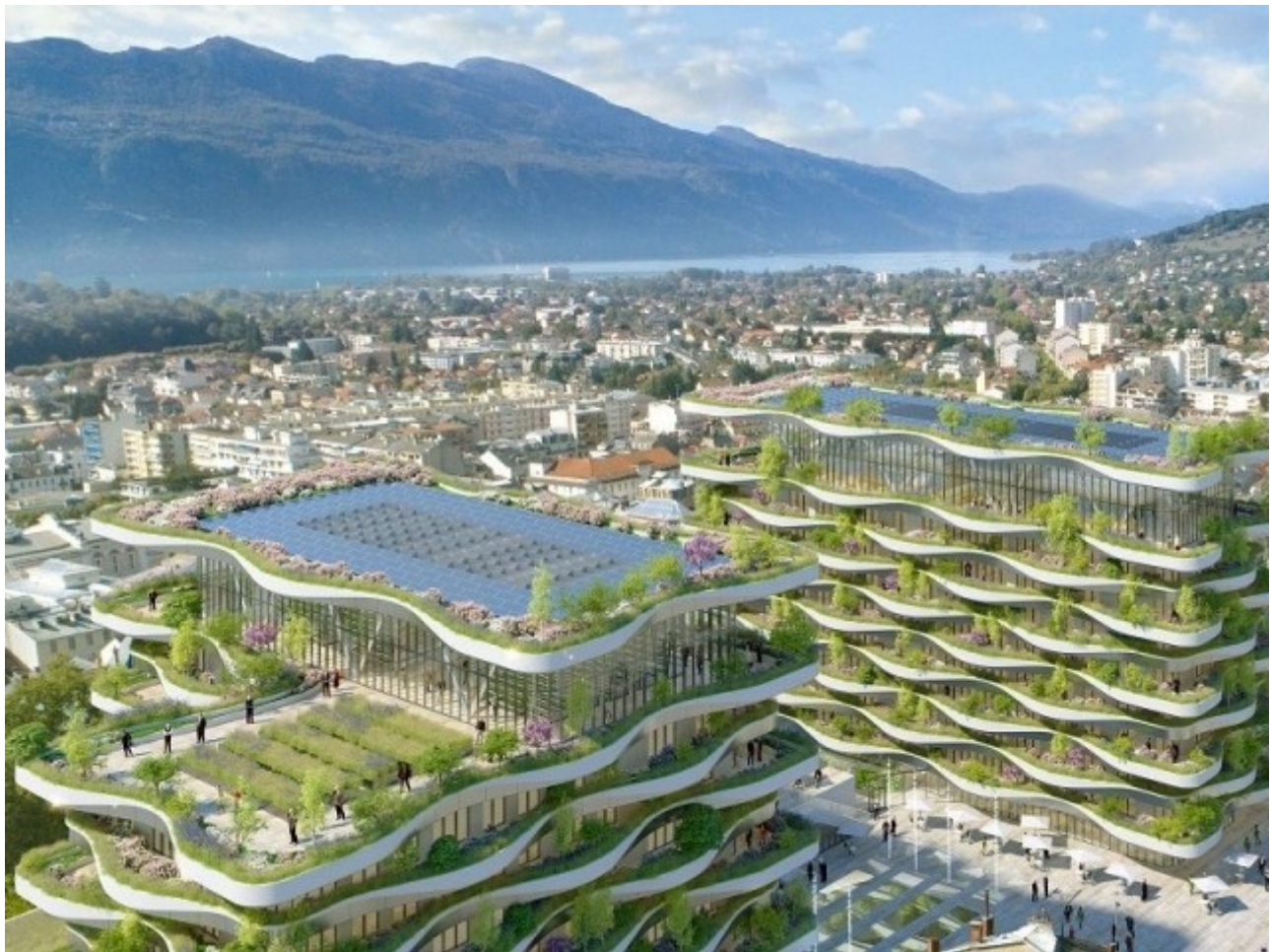
Un programme végétal - L'Ecume des Ondes © Vincent Callebaut Architectures

L'alimentation saine prendra une part importante dans le nouveau projet des thermes nationaux. De l'agriculture urbaine produisant fruits et légumes sera pratiquée sur les toits, balcons et espaces publics. S'appuyant sur les données de la FAO, le maître d'œuvre annonce : " Les jardins potagers peuvent être jusqu'à 15 fois plus productifs que les exploitations des zones rurales. Une superficie d'un mètre carré peut fournir 20 kg de nourriture par an ". Il est espéré que cette forme d'agriculture créera des emplois et diminuera les émissions de CO2 ainsi que les coûts.