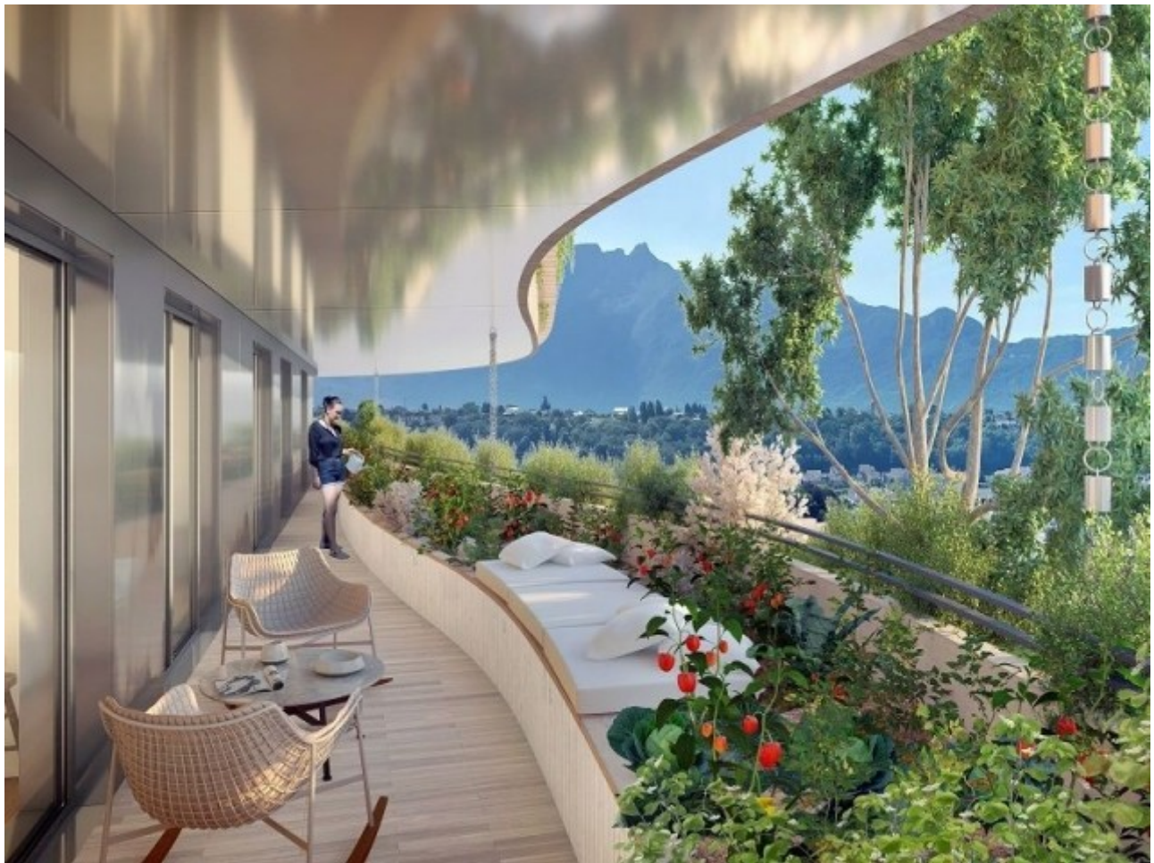
Des logis confortables - L'Ecume des Ondes © Vincent Callebaut Architectures

Les balcons ondulants, dotés de jardinières, seront agrémentés de fruitiers : groseilles, cassis, framboises, mures, myrtilles... Plaisir des yeux et plaisir des papilles.