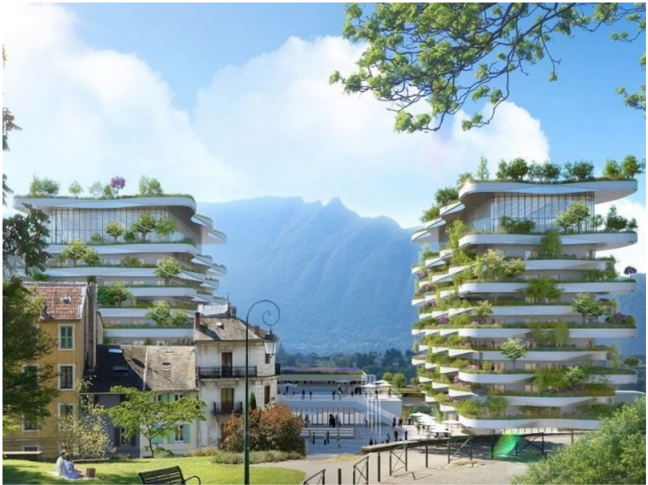
Des usages non genrés - L'Ecume des Ondes © Vincent Callebaut Architectures

Côté usages, les thermes nationaux d'Aix-les-Bains deviendront des lieux de vie décloisonnés qui regrouperont hébergements innovants, restaurants, galerie commerciale et espace de coworking. Dans les parties conservées, l'office de tourisme sera installé dans le bâtiment Pellegrini et un centre d'interprétation de l'Architecture et du patrimoine dans l'annexe Revel. Un centre de bien-être est envisagé dans le bâtiment des Princes, tandis que des locaux d'enseignement de l'école Peyrefitte occuperont l'extrémité sud du site, dans le bâtiment de la piscine Pétriaux. Les niveaux souterrains seront aménagés en parkings desservis par l'accès du parking de la mairie.