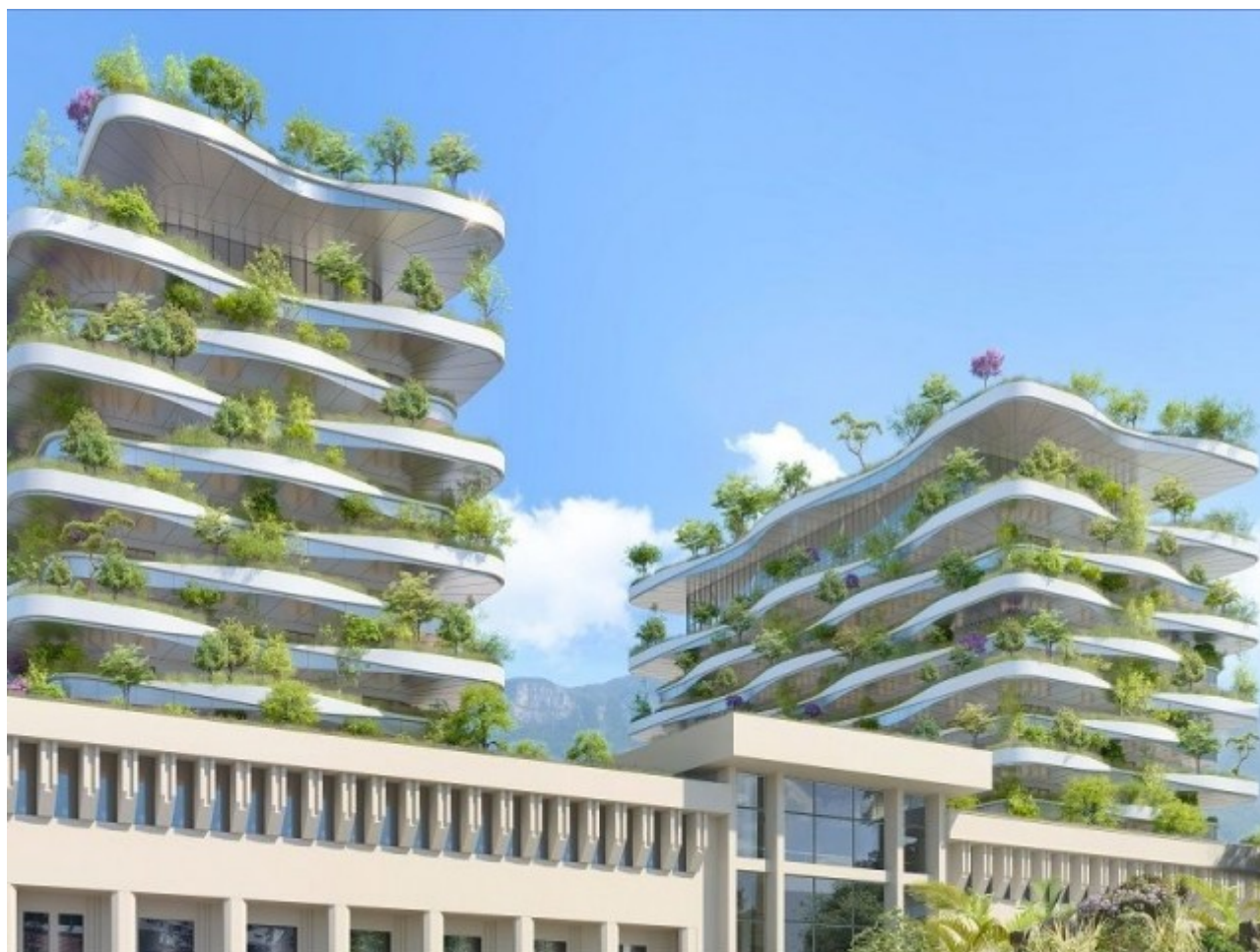
Un design naturel - L'Ecume des Ondes © Vincent Callebaut Architectures

Pour le design des constructions neuves, Vincent Callebaut évoque " une architecture résiliente, innervée de Nature ", une " ode à la biodiversité, aux énergies renouvelables et à l'économie circulaire " pour un monde post-carbone, post-fossiles et post-insecticides. Environ 185 logements premium nommé "Sky villas" s'étendront sur 13.000 m 2 , dont 25% seront réservés à du logement social et le reste mis en libre accession à la propriété.