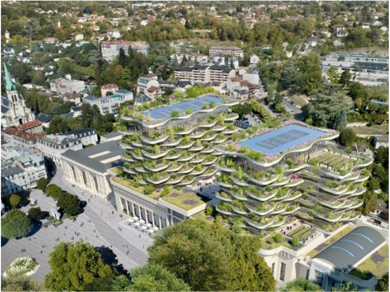
Insertion paysagère - L'Ecume des Ondes © Vincent Callebaut Architectures

Abondamment végétalisés et compacts, les deux immeubles de logements se font discrets.